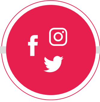
İNTERNET VE SOSYAL MEDYA