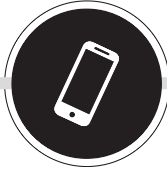
TELEFON VE TABLET